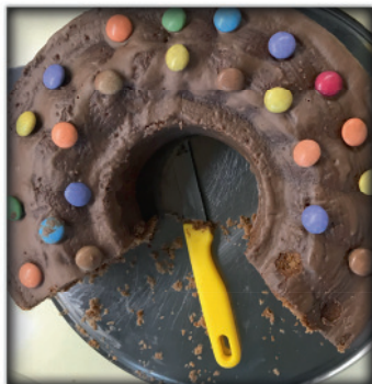
Hafenslohrer Bauanenkrauz mit Schokokugeln

Wir kommen auch gerne vorbei, und holen die Rezepte ab, erstellen die Fotos von Euren kulinarischen Ergebnissen, vielleicht auch verbunden mit einem kleinen Testessen .... ?!