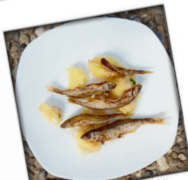
Hafenslohrer Meetschli mit Krumenrusalat

...Dessertrezept: Teigrudaka: 250 g Marg., 250 g Zucker, 6 Eier, 375 g Mehl, 1 Backpulver. Die Hälfte dieses Teiges wird auf ein Pergament belegtes Blech gestrichen. Die andere Hälfte des Teiges gibt einige Eßlöffel Kakao. Den dunklen Teig auf den hellen Teig gestrichen. Während die Saureinschen im Ofen abstand tief ausgedrückt. In der Mitte ca. 30 Min. backen. Die Kugeln passen. - Buttercreme (Trotzige Torte creme von In- -fest werden passen ->