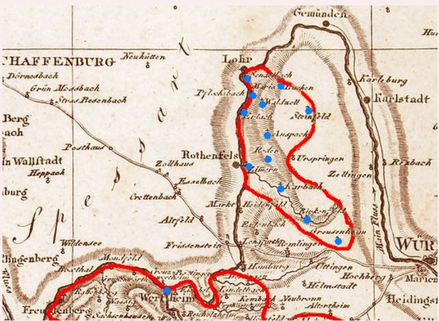
Badisches Amt Steinfeld 1806-1819

Einladung zur Jubiläumsfeier am Sonntag, 27.10.2019 in Karbach