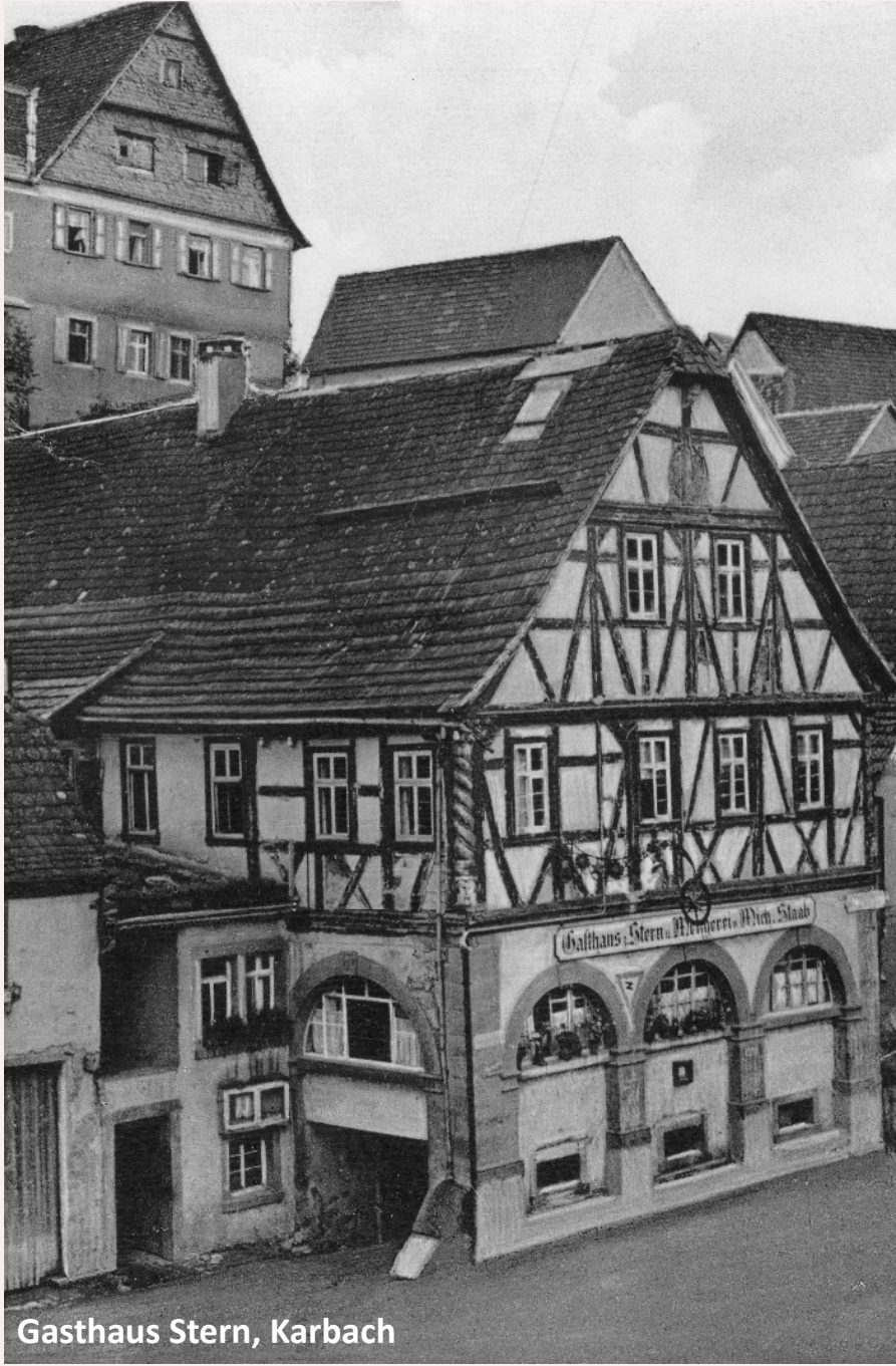
Gasthaus Stern, Karbach