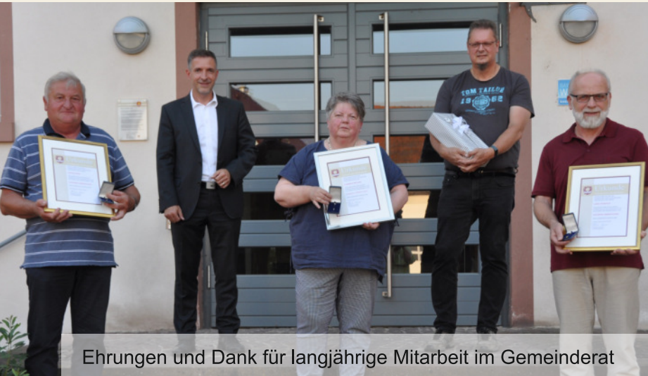
Ehrungen und Dank für langjährige Mitarbeit im Gemeinderat

Hafenlohr: Bürgerhaus-Hof Windheim: Bürgerhaus / FFW