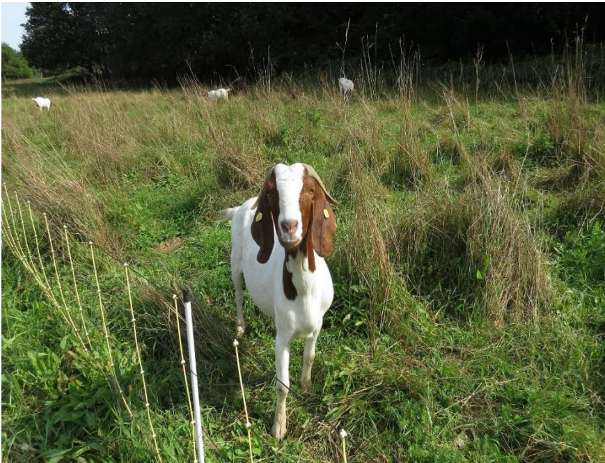
Bild 2: Beweidung mit Ziegen: Grünland, Streuobst und viele andere Flächen müssen regelmäßig genutzt werden, um dauerhaft erhalten zu bleiben ohne zu verbuschen.