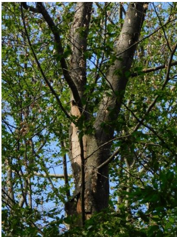
Abbildung 2 Auch Sonnenbrand setzt den Bäumen zu. In den nächsten Wochen finden im Amtsbereich Verkehrssicherungsmaßnahmen statt. Dennoch ist auch auf Waldwegen erhöhte Vorsicht geboten