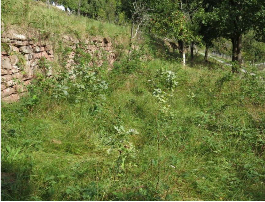
Bild 1: Brombeergestrüpp statt Magerrasen: Insbesondere Flächen in Ungunstlagen, wie hier an einem relativ steilen, terrassierten Hang, sind durch Nutzungsaufgabe und Verbuschung bedroht.