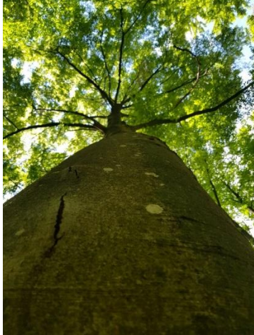
Abbildung 1 Astabbrüche können für Waldbesuchende gefährlich werden

Fotomaterial darf für diese Meldung honorarfrei in allen Medien verwendet werden.