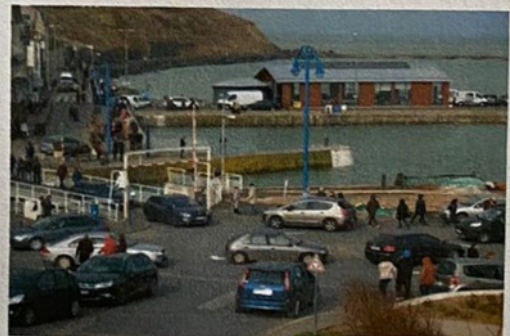
Le port de pêche de Port en Bessin