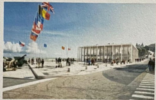
Le musée d'Arromanches

Die Programmpunkte bei unseren französischen Freunden: