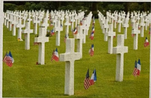
Le cimetière Américain de Colleville