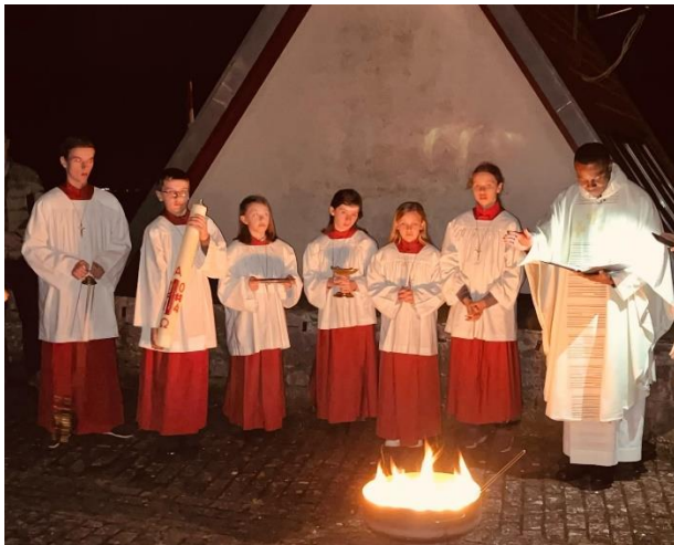
Osternacht in Hafenlohr