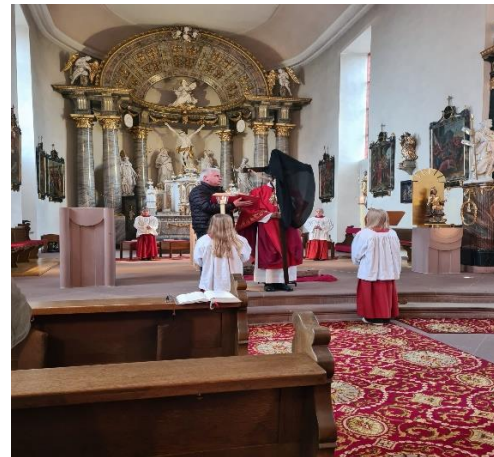
Karfreitagsliturgie in Hafenlohr