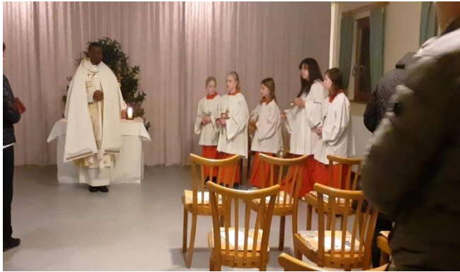
Gründonnerstag in Bergrothenfels