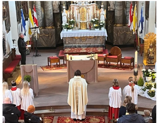
Familiengottesdienst am Ostermontag in Hafenlohr

Bild & Text: Ines Zelder, Ministrantenmitverantwortliche Hafenlohr