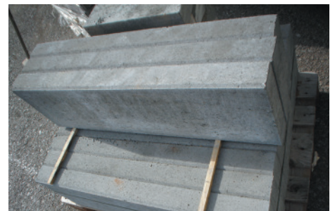
Leistensteine grau oder braun 30x8x100cm oder 20x8x100cm ab 1,75 €