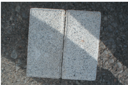
Beispiel Parkettstein Granit weiß gestrahlt

Wir liefern und verlegen zu günstigen Konditionen. Preise auf Anfrage oder komplett schlüsselfertig. Wir beliefern Sie auch mit Schüttgütern aller Art (Sand, Schotter, Splitt...). Preise pro m 2 , pro Stück oder nach Vereinbarung.