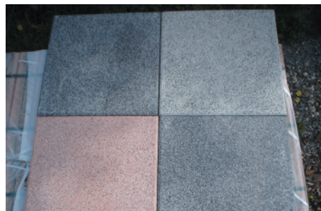
Terrassenplatten 40x40x4cm versch. Farben teils imprägniert ab 1,20 € pro Stück